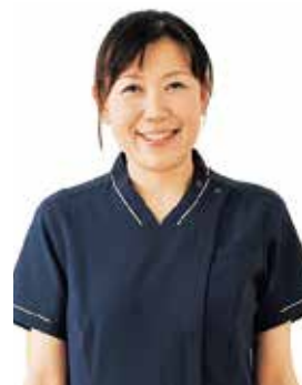
看護副部長 教育担当部門師長

能性が高いため、継続的に関わっていかねばなりません。そのためには患者さんやご家族に対して、その時々にあった情報提供・相談支援を行うことが重要であるため、多職種で対応する「脳卒中相談窓口」でこの役割を担っていきます。「脳卒中相談窓口」で対応する職種は、脳卒中専門医、脳卒中に精通した看護師の他に、社会福祉士、理学療法士、作業療法士、言語聴覚士、薬剤師、管理栄養士で構成されます。私は脳卒中リハビリテーション看護認定看護師として、患者さんにご家族の思いや悩みを聴いて、必要なケアを考え患者さんの意思決定を支援し、患者さんがその人らしい生活が送れるよう貢献していきたいと考えています。