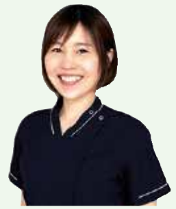
認知症看護認定看護師

私は令和4年度に認知症看護認定看護師を取得しました。認知症看護認定看護師の教育課程で学んだ認知症の知識と看護技術を活かし、認知症患者さん一人一人に寄り添い、向き合うことで患者さんのその人らしさや笑顔を引き出したいと思います。そして、入院を要する場面で苦痛や環境変化に懸命に向き合う認知症患者さんの看護を看護職員と共に考え、患者さんが安心できる療養環境を作ります。また、認知機能の低下があるなかでも安心して地域の生活に戻ることができるように、医師やリハビリ職員など多職種と協働し患者さんとそのご家族を支えています。